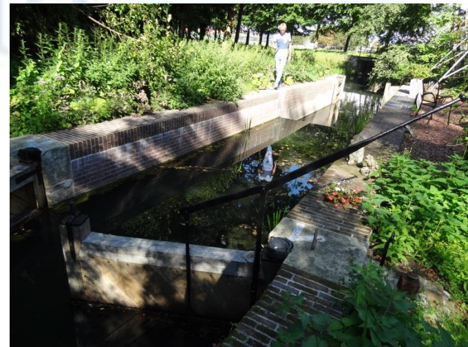
De schutsluis/stuw op het Landgoed Elswout te Overveen

Aannemer: Aannemersbedrijf B. van Hees en Zonen, Nieuwegein.